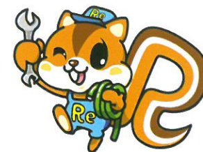
水回りのリフリス