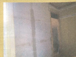
仕上げのクロスも、耐震壁に直接貼れます。