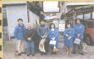
T様ご自宅近隣をお掃除させて頂きました。ありがとうございました♪