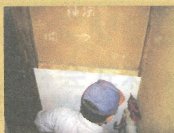
耐震パネルを下地に留めます。