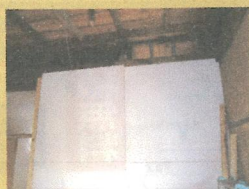
耐震パネル貼り後です。