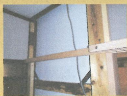
耐震壁を裏側から見た所です。