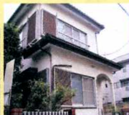
施工前・・・ 汚れが目立ってきて来 てしまっていました。