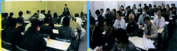
経営計画発表会 4月23日