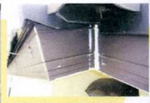
隙間埋め処理もしっか りさせて頂きました。