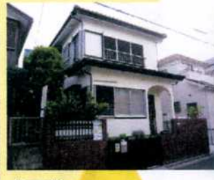
施工後・・・ 白とブラウンのコントラストが はっきりと綺麗なご自宅に リフォームされました！