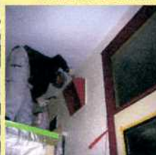
鉄部の錆止め 塗装中です。