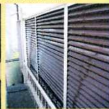
雨戸も塗装してピカ ピカになりました。