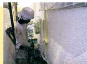
下塗り後、中塗り作業 中です。

梅雨入り前に工事をされたいという事 で、今回 外壁塗装・雨樋の工事をさ せて頂きました。今年の梅雨入りは例 年に比べ2週間程早まりましたが、予 定通り梅雨入り前に工事終了しまし た。当社で力を入れてさせて頂いて いる耐候性・防水性・透湿性に優れた【ア ステック塗料】を使用させて頂きまし た。住宅塗装勉強会を随時、開催さ せて頂いていますので、ご興味のある方 は是非、お気軽にご参加下さい。