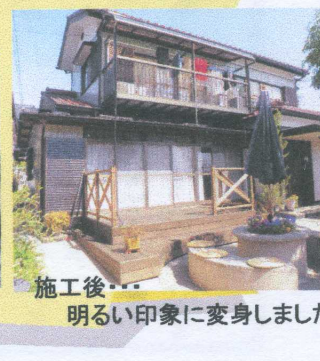
施工後・・・明るい印象に変身しました。