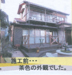
施工前・・・茶色の外観でした。