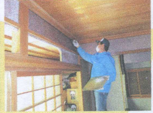
和室の繊維壁の塗り替え左官工事。