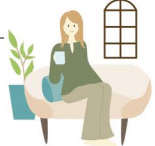
イラスト - みる